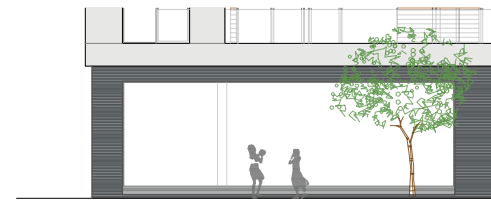
ALZADO OESTE - RÍO